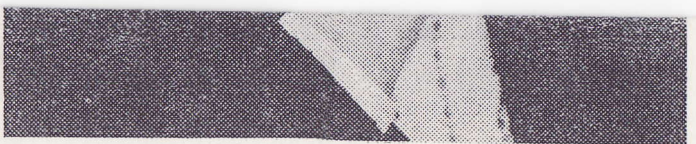
nicht halt machen

Fix: Das zeigt auch ein Paragraph im ISDN Staatsvertrag, der demnächst kommen wird. ISDN sind